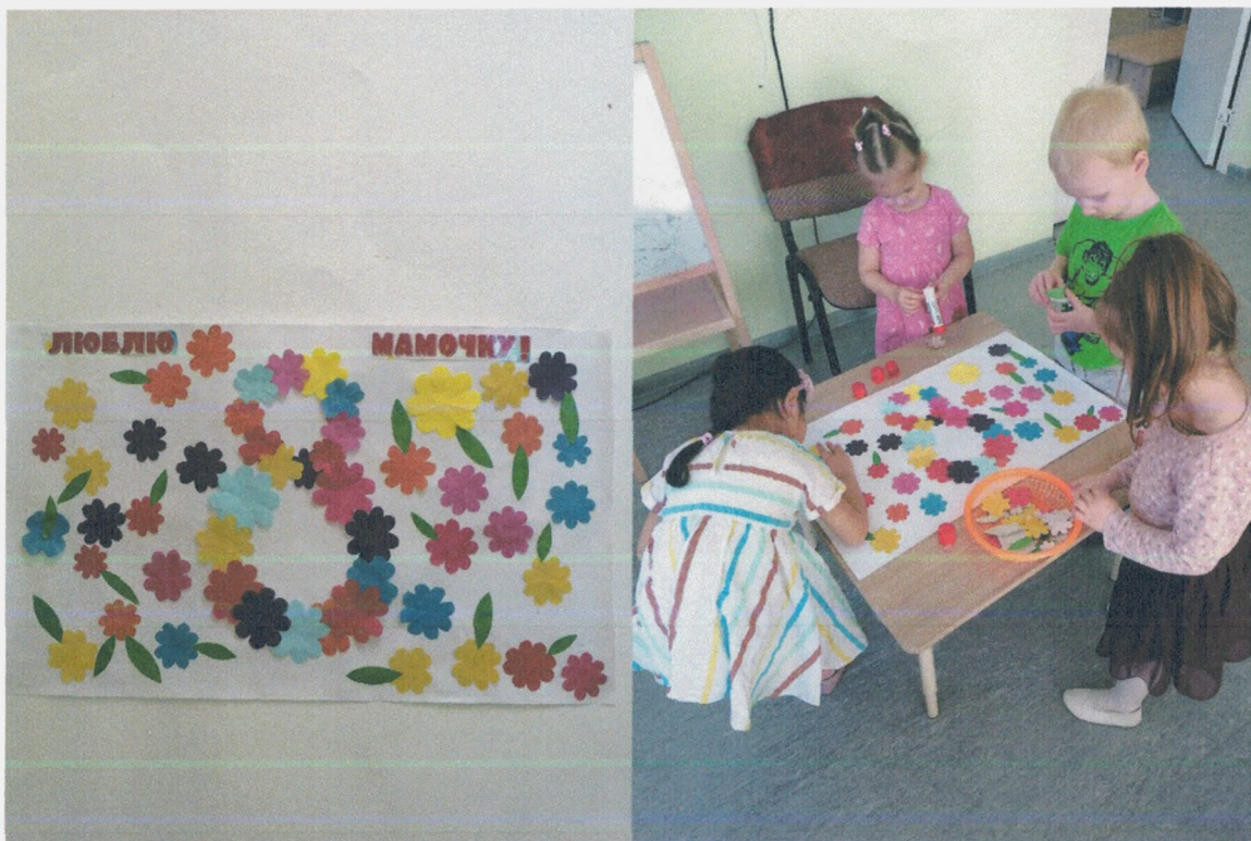
Рисование «Цветы для любимой мамочки»: