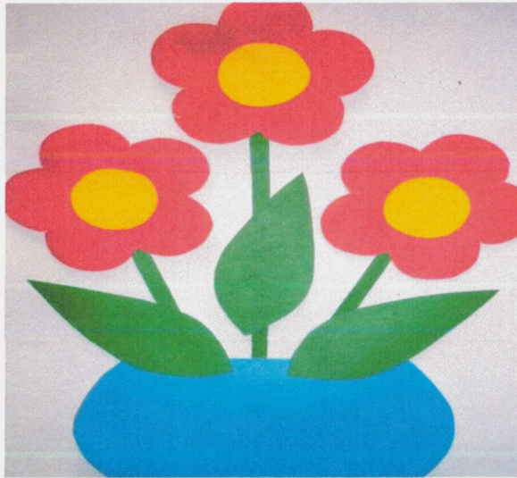
Оформление предметно – развивающей среды: